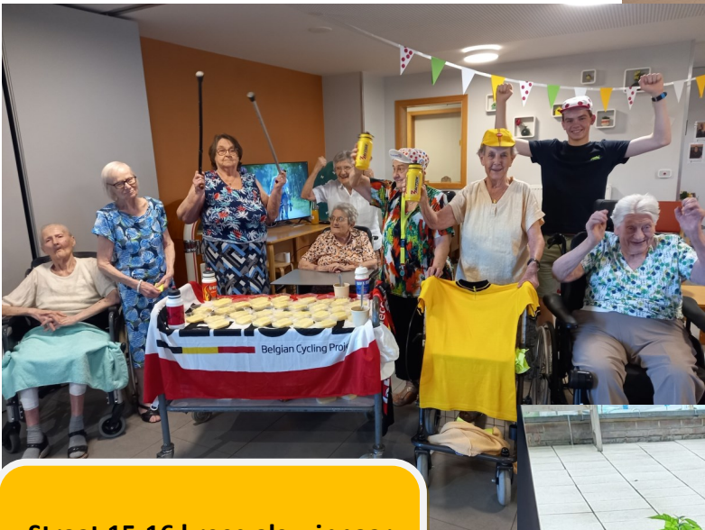
Straat 15-16 kreeg als winnaar verse rijstap!