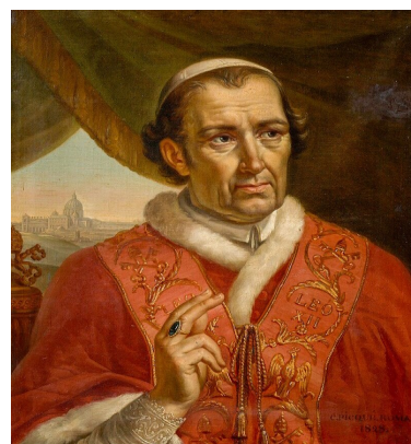
Paus Leo XIII

Het gebruik om jaarlijks de hele maand oktober in het teken van de rozenkrans te stellen, dateert uit de 19e eeuw. Het was paus Leo XIII (1878-1903) die een intensere Maria-devotie in deze maand bevorderde door zijn oproep om extra vaak de rozenkrans te bidden. . Alle pausen na Leo XIII hebben in navolging van hem de gelovigen opgeroepen in oktober extra tijd aan de rozenkrans te besteden.