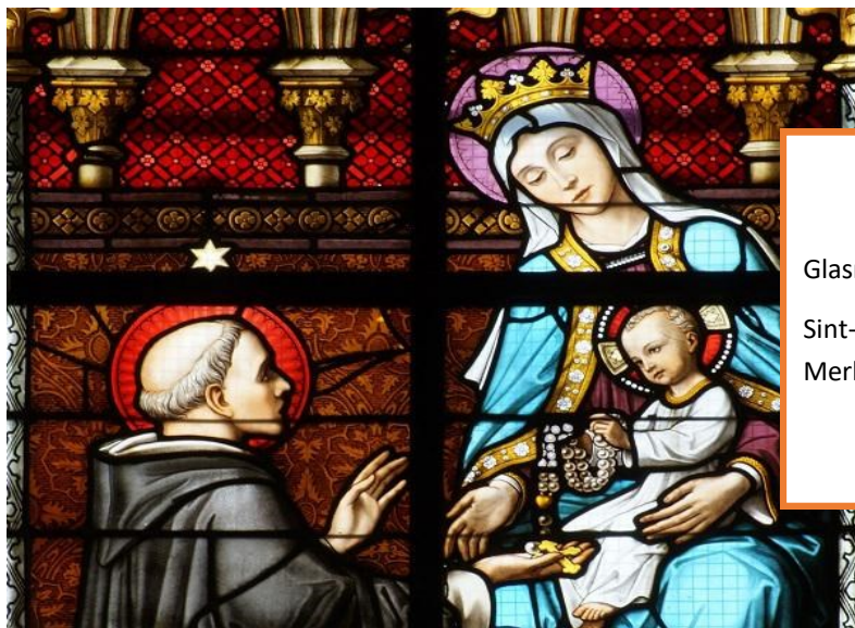
Glasraam De Rozenkrans, Sint-Willibrorduskerk, Merksplas

In de Rooms-Katholieke Kerk is de maand oktober gewijd aan de Rozenkrans. De keuze van deze maand hangt samen met de liturgische gedachtenis van Maria van de Rozenkrans op 7 oktober. Deze viering werd ingesteld door de heilige paus Pius V in 1571. Hij had de christelijke overwinning van de Slag bij Lepanto (7 oktober 1571) toegeschreven aan het bidden van de rozenkrans.